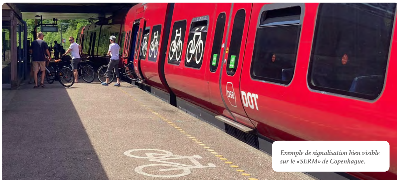
Exemple de signalisation bien visible sur le «SERM» de Copenhague.