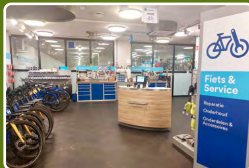
Exemple d'une vélostation à Maastricht, on peut y stationner et y faire réparer son vélo.