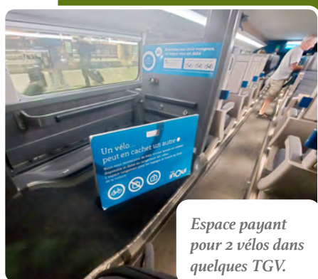
Espace payant pour 2 vélos dans quelques TGV.