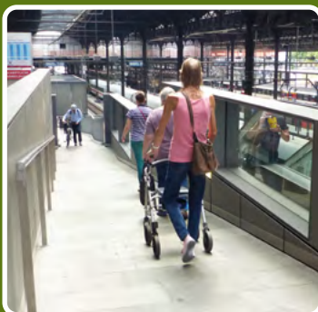
La rampe idéale aussi pour les autres usagers. Une goulotte assez large évite de coincer guidon et sacoches dans la main courante.